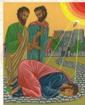
"Conversión de San Pablo" Teresa Groselej

Yo, que estoy preso por el Señor, los exhorto a comportarse de una manera digna de la vocación que han recibido... Traten de conservar la unidad del Espíritu, mediante el vínculo de la paz. Hay un solo Cuerpo y un solo Espíritu... Hay un solo Señor, una sola fe, un solo bautismo. Hay un solo Dios y Padre de todos, que está sobre todos, lo