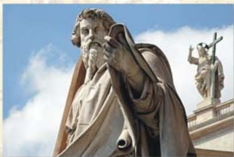
San Pablo Apóstol - Vaticano

A él sea la gloria en la Iglesia y en Cristo Jesús, por todas las generaciones y para siempre. Amén (Cfr Ef 3, 14-20).