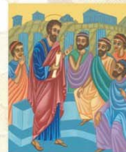
"San Pablo en el areópago" Teresa Groselej

Prediqué gratuitamente la Buena Noticia, renunciando al derecho que la misma me confiere. En efecto, siendo libre, me hice esclavo de todos, para ganar al mayor número posible. Me hice débil con los débiles, para ganar a los débiles. Me hice todo para todos, para ganar por lo menos a algunos, a cualquier precio. Y todo esto, por amor a la Buena Noticia, a fin de poder participar de sus bienes (Cfr 1 Cor 9, 18-19. 22-23).